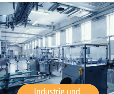
Industrie und Handwerk

Umfassende Oberflächenreinigung in verschiedenen professionellen Bereichen.